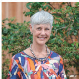
アストリッド ・クライン

建築家のアストリッド・クライン氏は、「代官山T-SITE/蔦屋書店」やGoogle日本オフィスなどその豊かな色彩感覚と洗練された感性を用いて国内外に数多くの空間を手がけています。また2011年より開校した建築家・伊東豊雄氏が塾長を務める「子ども建築塾」の講師としても携わっています。今回の対談では、伊東氏が現在、最も力を注いでいる次世代の教育について、今治市伊東豊雄建築ミュージアムにて開催中の「子どもと共に建築を考える」展を掘り下げながら、なぜ今子どもの建築教育に可能性を感じているのか、これからの建築教育について語り合います。